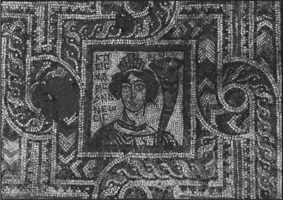
Resim 4: Peristyl dođu portiko Ktisis mozaigi.