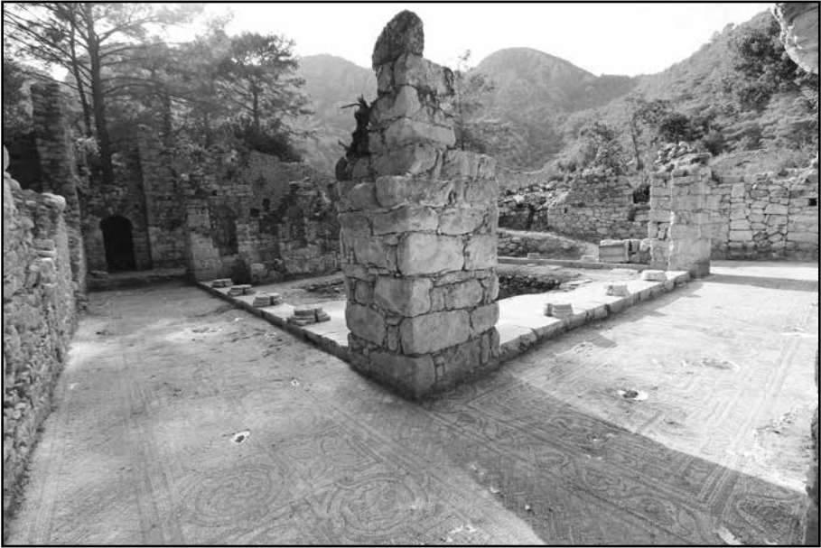
Resim 6: Peristyl kazı sonrası genel görünüşü.