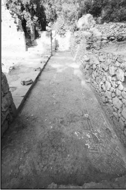
Resim 5: Peristyl güney portiko mozaikleri.