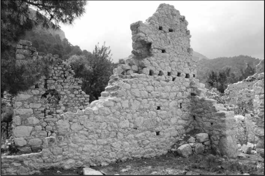
Resim 2: Yapı ada No VI güney duvar onarım sonrası görünüşü.