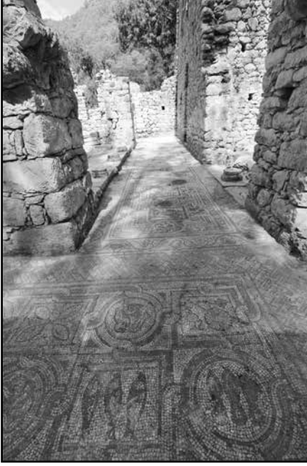
Resim 3: Peristyl dođu portiko mozaikleri.