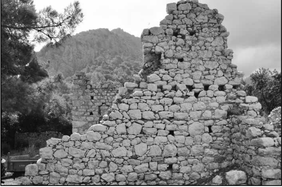
Resim 1: Yapı ada No VI güney duvar onarım öncesi görünüşü.